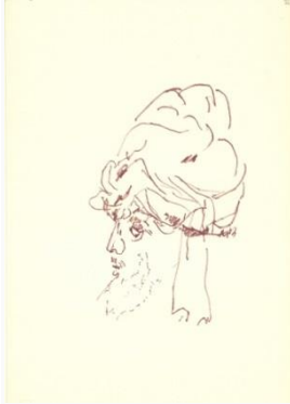
Okolo 1996, flamaster / papier, 24 × 16 cm ze zbiorów Biblioteki Narodowej w Warszawie