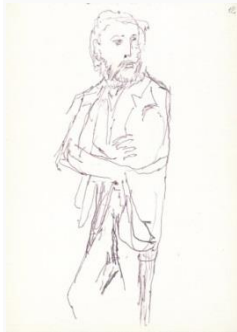
Okolo 1998, długopis / papier, 14,8 × 10,5 cm ze zbiorów Biblioteki Narodowej w Warszawie