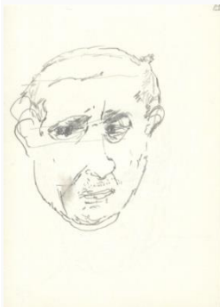
Wrzesień – listopad 1997, ołówek / papier, 14,8 × 10,5 cm ze zbiorów Biblioteki Narodowej w Warszawie