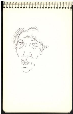
Okolo 1990, flamaster / papier, 19 × 12,5 cm ze zbiorów Biblioteki Narodowej w Warszawie