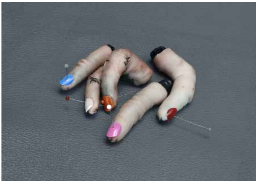
Aneta Grzeszykowska, Selfie #3, 2014

w Negative Book ) albo zgoła sztuczne (jak w cyklu Selfie , gdzie przedstawione na zdjęciach elementy ciała powstały z prawdziwej skóry). A jednak, istniejące czy nie, prawdziwe czy mechanicznie odtworzone, ciało za każdym razem jest selfie autorki, migawką z jej wadzenia się z bytem.