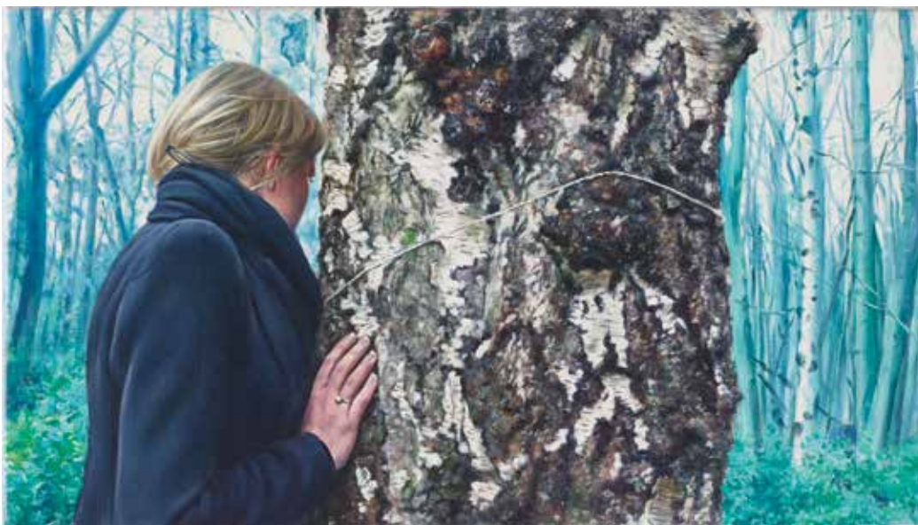
Robert Devriendt, #2, z cyklu Gotycka noc (La nuit gothique 1) , 2015, olej / płótno, 16,7 × 28,7 cm. Courtesy R. Devriendt

Co łączy kobietę pod prysznicem, zbliżenie na instalację elektryczną, pokój z telewizorem i mężczyznę z kamerą? Sportowy samochód, modernistyczną podmiejską willę i postać femme fatale? Tych zależności nie powinno się ujawniać – całą radość interpretacji należy pozostawić odbiorcy. Każdy tworzy historie indywidualnie, zależnie od swoich doświadczeń, percepcji, wnikliwości. Wizualna sekwencja ma stanowić bodziec do przeprowadzenia własnego śledztwa, połączenia historii w całość. Większość prezentowanych cykli nosi bowiem tytuł Niewyjaśniona sprawa , sugerując brak gotowego rozwiązania zagadki.