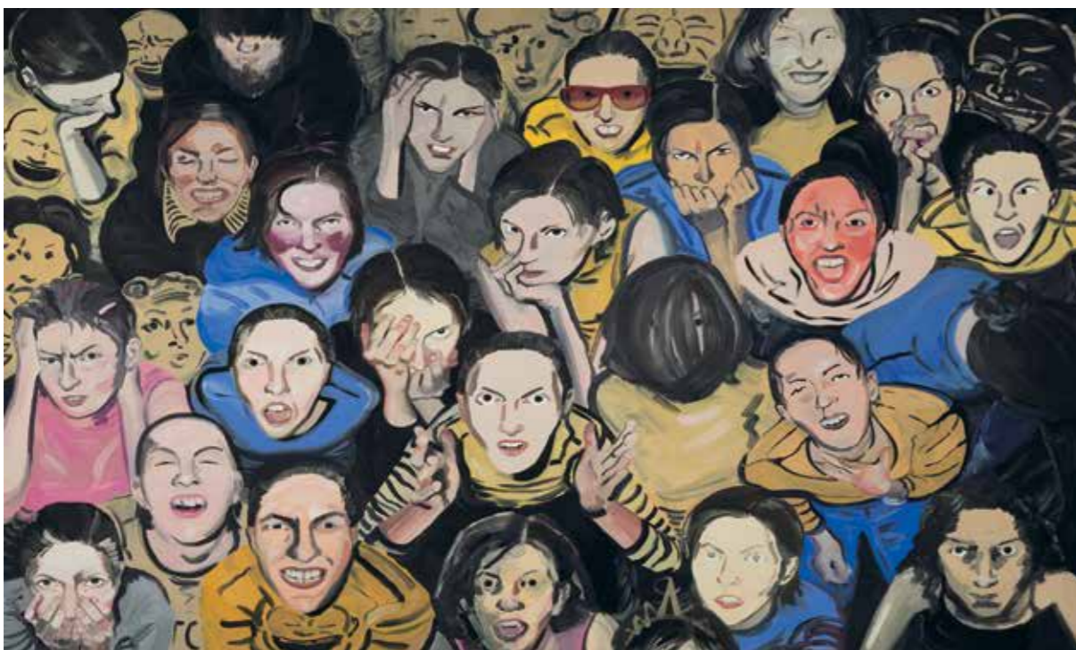
Pola Dwurnik, Litości! , 2008/2009, olej / płótno, 150 × 210 cm

Urodzona w 1979 roku w Warszawie. Zajmuje się głównie malarstwem, rysunkiem oraz tworzeniem komiksów.