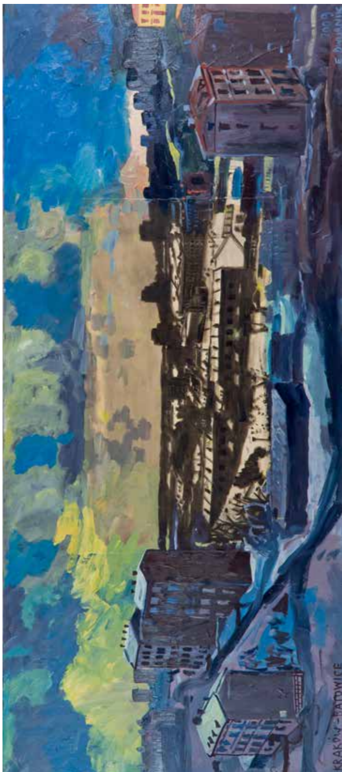
Edward Dwurnik, Batowice , 2009, olej / płótno, 120 x 180 cm