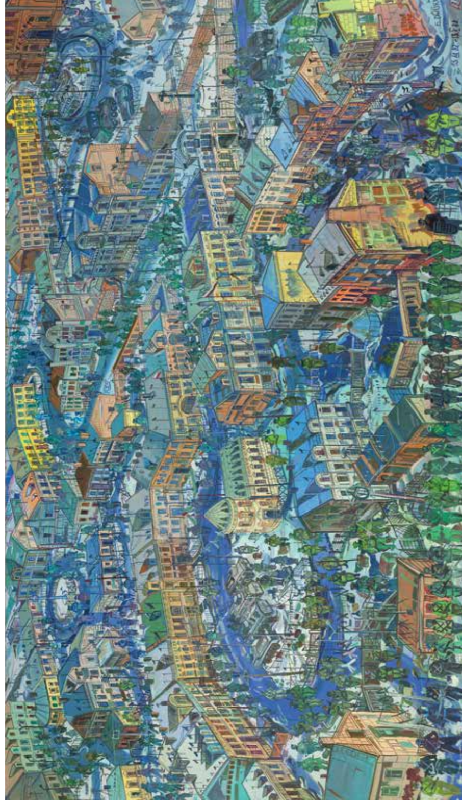
Edward Dwurnik, Obława na groźnego bandytę , 1982, olej / płótno, 250 × 410 cm

Urodzony w 1943 roku w Radzyminie. Zajmuje się głównie malarstwem, rysunkiem oraz grafiką.