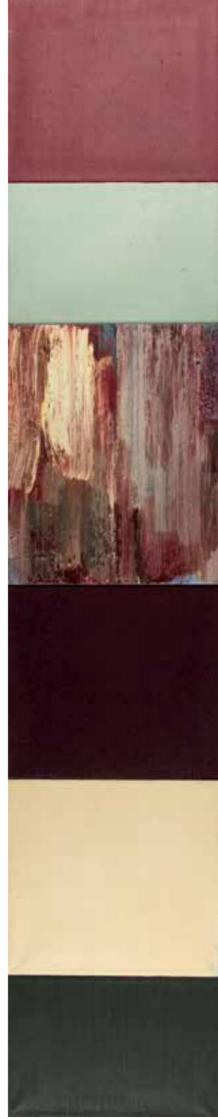
Tomasz Ciecierski, bez tytułu, 2002, olej / płótno, nadruk na piance modelarskiej, 38 x 199,5 cm

Urodzony w 1945 roku w Krakowie. Zajmuje się głównie malarstwem, rysunkiem i fotografią.