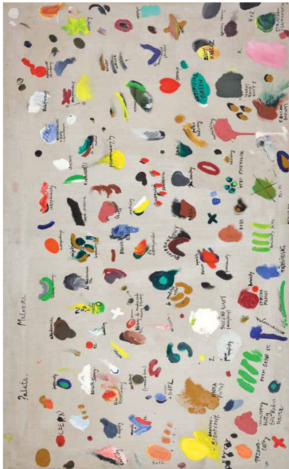
Tomasz Ciecierski, Paleta malarska, 1972, olej / płótno, 70 x 130 cm